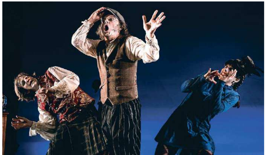
‘Paüra’ se sumerge en el lenguaje de los payasos y trata el miedo desde la carcajada y la poesía. AVTO

Paüra es además una de las obras incluidas en el circuito estatal Circo a Escena, programa promovido por el Instituto de las Artes Escénicas y de la Música (INAEM) y desarrollado por La Red Española de Teatros, Auditorios, Circuitos y Festivales de titularidad pública. El Teatro Alameda ha sido uno de los espacios seleccionados -el único en Andalucía- en la segunda edición de este programa de impulso a las artes circenses y, gracias a esta participación, acogerá la puesta en escena de este espectáculo y de Karpaty , de La Troupe Malabó, los días 11 y 12 de diciembre.