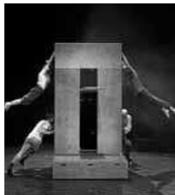
Un momento de 'Nuye'.

vo recalca en el Laboratorio de las Artes de Valladolid (LAVA). El montaje se podrá ver el sábado 15 de octubre (20:30 horas, 12 euros) dentro de un ciclo que se prolongará hasta finales de año con 'El desván' (del colectivo Cirque entre Nous, el 10 de diciembre) y 'Sopla!', de Truca Circus, un espectáculo familiar para el viernes 30 de diciembre.