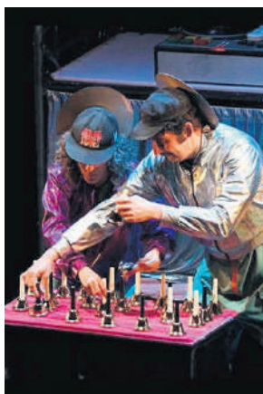
'LA LITERA' LLEGA A TENERIFE. DA