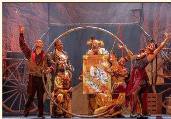
Uno de los espectáculos circenses enmarcados en el ciclo.

Cia D'Click, Cia. Manolo Alcántara, Planeta Trampolí, Cirk About It y Cia Toti Toronell. La primera cita –ayer en Vinaròs– corrió a cargo de La Fam Teatre, que puso en escena su espectáculo Ambulant , un homenaje a los últimos circos clásicos de principios del siglo XX. Hoy será el turno (a las 22.30 horas en la pérgola del paseo de Colom) de la compañía aragonesa Cia D'Click, que pondrá en escena su espectáculo Latas , que aborda de manera sutil cuestiones como el cambio climático, la sostenibilidad y las relaciones humanas.