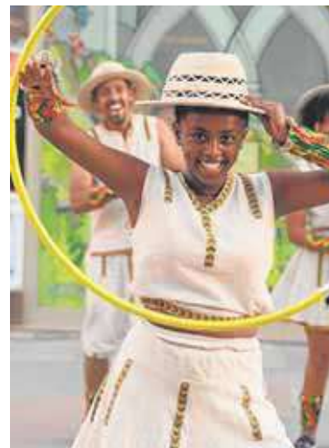
El espectáculo 'Greed'. KINÉ CIRCUS

El día 20 de octubre a las 20.00 horas en el Teatro Circo Murcia –entradas: 10 euros– la compañía castellanense La Fam Teatre pondrá en escena su espectáculo 'Ambulant', un home-