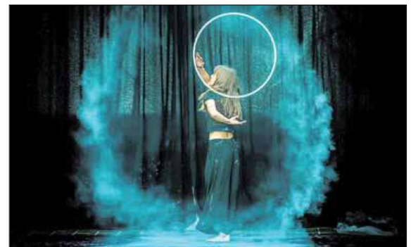
La pieza '361 grados' está programada para el jueves 5. DL

El sábado 7, la delegación española del movimiento Save the Temazo, creado en 1971 por activistas musicales canadienses y en el que colaboraron nombres como David Bowie, Gloria Gaynor, Chuck Berry o Tina Turner, presentará 'Indoor', un trabajo que usa proyecciones en direc-