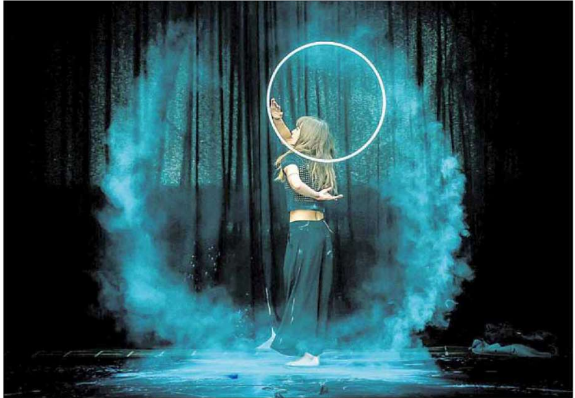
Espectáculo del ciclo Circo Sin Red '361 grados', con Proyecto Tránsito, uno de las nueve actuaciones previstas. DL

Ponferrada vuelve a apostar por el arte del circo. Y lo hace con nueve espectáculos al aire libre, aprovechando los últimos coletazos del verano en los Jardines del Sil, y bajo cubierto en el Teatro Bergidum con una segunda parte para el otoño