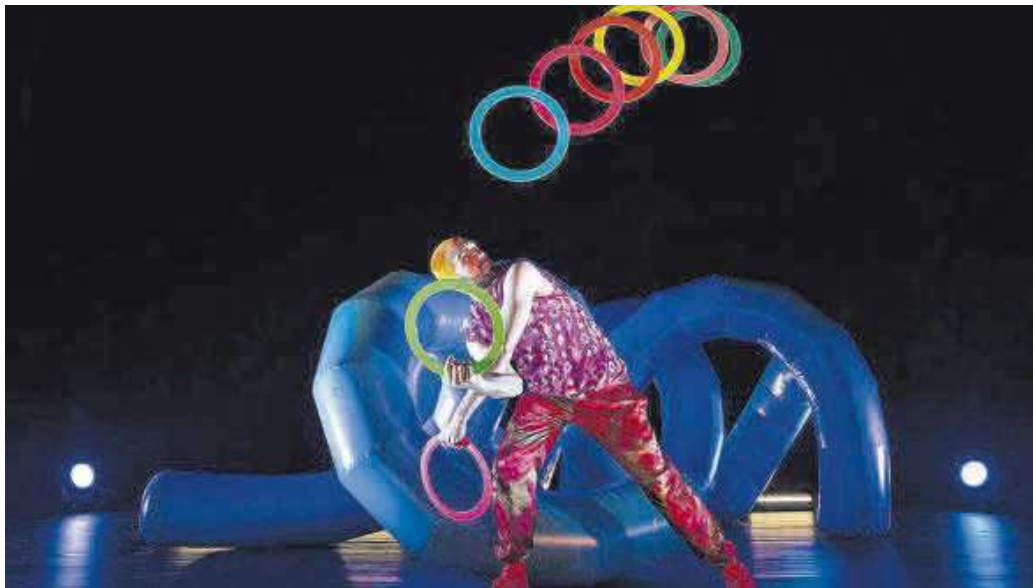
Imaxe da peza 'Rollercoaster' do malabarista estadounidense Wes Peden / FAHIMEH HEKMATANDISH