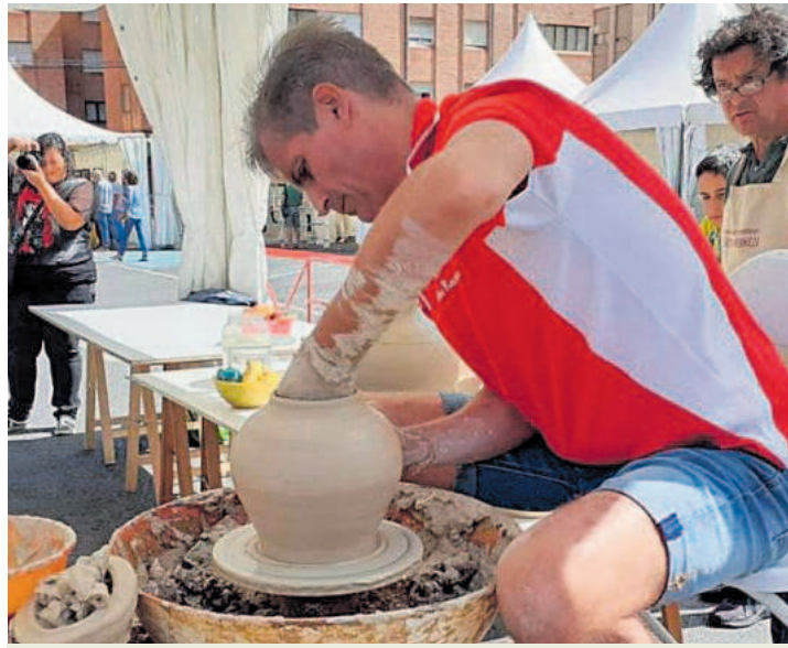
La Feria de la Cerámica se instalará en el parking de Obispo Osmundo. JAVI FERNÁNDEZ

12:15 a 13:35h.- Programa de radio en directo. "esRadio Bierzo 98.7 FM".