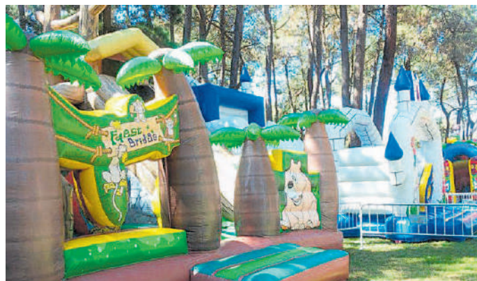
CIMA es uno de los proyectos más interesantes para los niños en la ciudad.

19:30h.- Gran Mercado Medieval. Exhibición de vuelo rasante, con interacción de las aves rapaces y el público visitante que así lo desee. 19:30h.- Apertura casa de Andalucía. Junto a la estación de autobuses. 20:00h.- CIRCO SIN RED. 'VOLOV' Col. Lectiu TQ' Espectáculo para todos los públicos. Jardines del Sil.