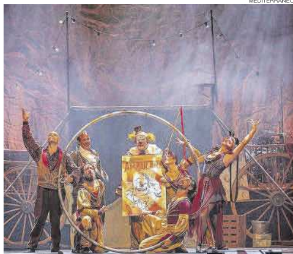
Una imagen de archivo de la actuación de una de las compañías circenses.

El concejal de Cultura, Vicente Blay Casino, destaca que Almassora contará con una programación para todos los públicos, con mucho protagonismo para el circo. ≡