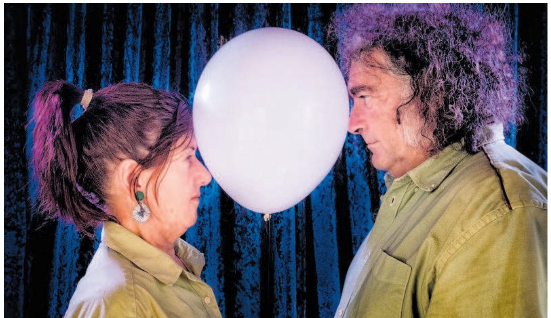
'La grutesca' es un trabajo singular que mezcla circo y teatro.

Las localidades para cada función tienen un precio de 5 euros y se oferta un precio especial con descuento para las cuatro funciones del ciclo por 20 euros, sólo en taquilla.