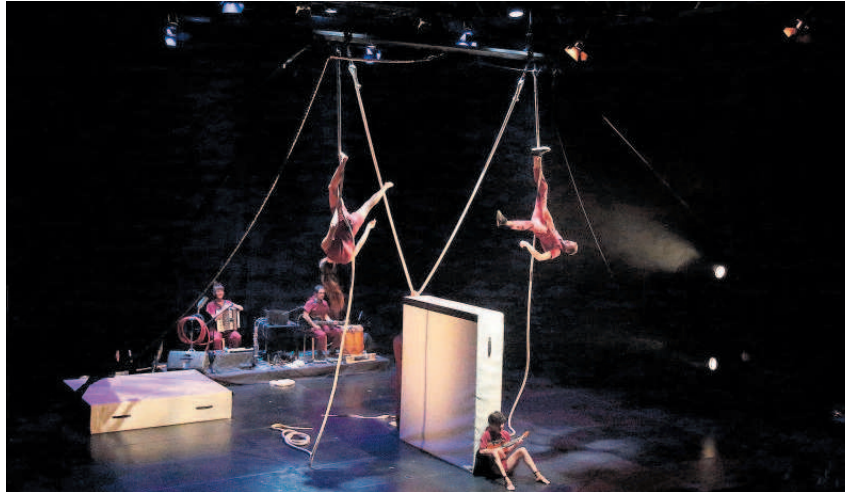
Espectáculo que podrá verse dentro del nuevo programa.