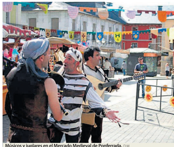
Músicos y juglares en el Mercado Medieval de Ponferrada. D.M.

14:30h.- XXIII Torneo de la Encina de Golf. Instalaciones Club de Golf