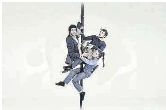
Plano de 'Latas', espectáculo de la compañía DClick / CIA. D'CLICK

“Hay muchas mujeres en el circo social, en el pedagógico y en talleres pero conforme la responsabilidad va subiendo, aparecen cada vez menos mujeres, ejemplo de lo que nos queda por mejorar”.