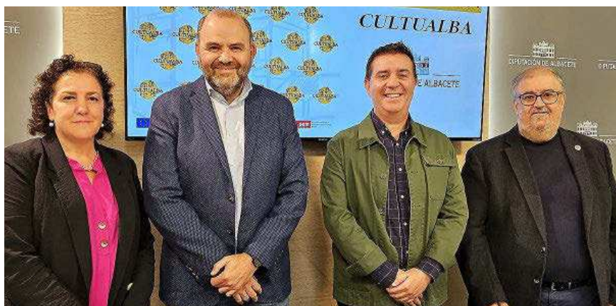
Un momento de la presentación del nuevo recurso cultural para localidades y compañías profesionales.

La plataforma, impulsada por el Consorcio Cultural Albacete, será un punto de encuentro para la gestión