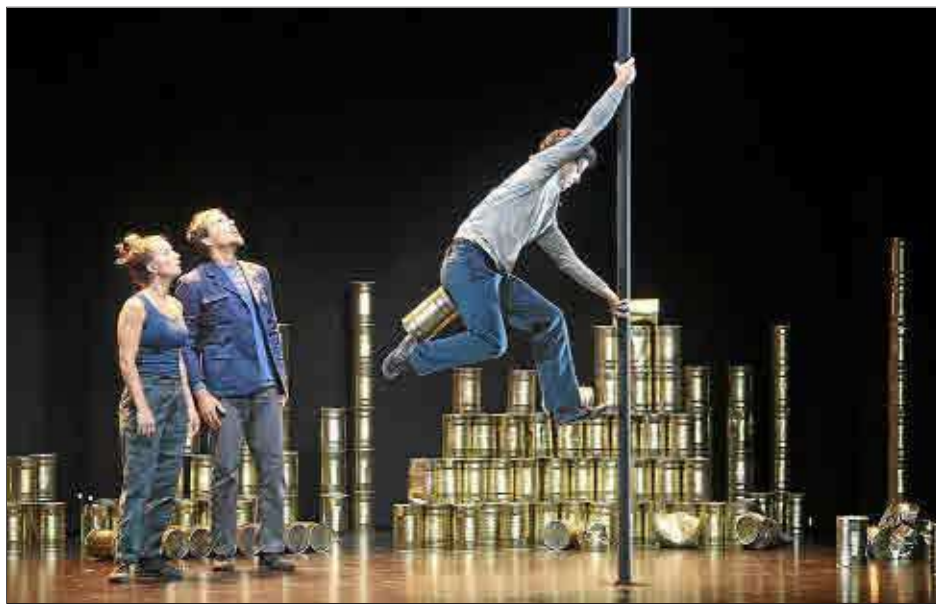
Imagen de la representación del espectáculo «Latas» en 'Es Born'.