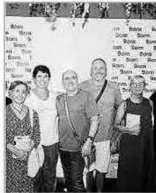
Una edició anterior.

D’aquesta manera, el circuit tornarà a visitar Ciutadella un any més.